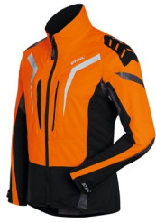
林業用の目立つ色合いの防護衣