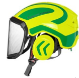
フェイスガード・イヤーマフ付ヘルメット