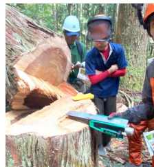
令和5年度事業で実施された研修会