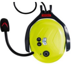
イヤーマフ型無線機